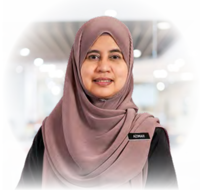
YBHG. DATUK NOR AZIMAH BINTI ABDUL AZIZ Ketua Pegawai Eksekutif Suruhanjaya Syarikat Malaysia

Saya dengan sukacitanya membentangkan Laporan Tahunan Suruhanjaya Syarikat Malaysia (SSM) tahun 2021. Tahun ini merupakan tahun kedua negara kita mengharungi cabaran pandemik COVID-19. Walau bagaimanapun, kita bersyukur kerana Program Imunisasi COVID-19 Kebangsaan (PICK) yang dilaksanakan segera telah berjaya mengekang penularan wabak ini dan seterusnya membawa kepada pengoperasian semula sektor perniagaan untuk menyokong proses pemulihan ekonomi negara.