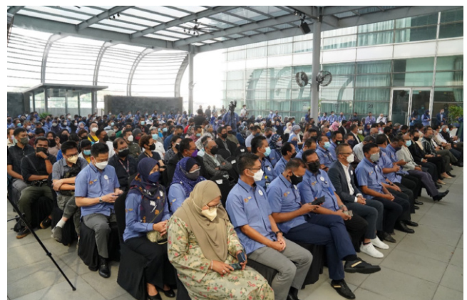
Para jemputan yang menghadiri sambutan Hari Ulang Tahun SSM ke-20 di Menara SSM@Sentral.