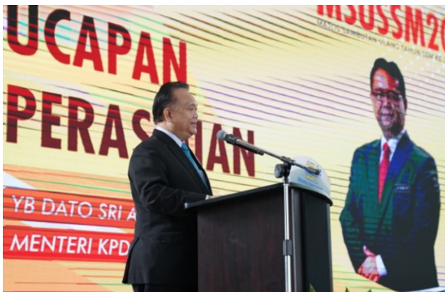
Ucuptama oleh YB. Dato Sri Alexander Nanta Linggi, Menteri PDNHEP semasa merasmikan MSUSSM20 pada 15 April 2022 di Menara SSM@Sentral, Kuala Lumpur.

Di samping itu, SSM turut menganjurkan pelbagai aktiviti bersempena sambutan ini seperti Program Jejak Pesara SSM, Jejak Asnaf Usahawan serta Program Bantuan Sumbangan kepada pihak yang memerlukan. Selain itu, SSM juga menganjurkan PUM22, PBU22, Program Taklimat BizTalk , Corporate Talk , pembukaan kaunter EzBiz On The Go dan kaunter khidmat nasihat, Program Mega Walkabout SSM, edaran kurma dan bubur lambuk, aktiviti jualan, pembukaan reruai pameran, aktiviti sukan serta lain-lain aktiviti yang telah disusun khas bagi memeriahkan lagi sambutan ini.