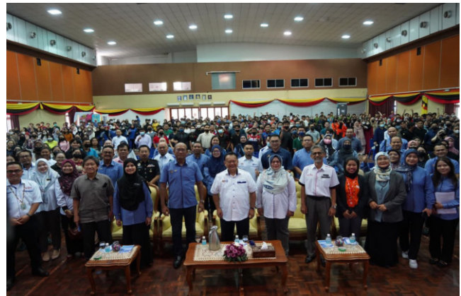
YB. Dato Sri Alexander Nanta Linggi, Menteri PDNHEP bersama para peserta PUM22 Peringkat Negeri Sarawak yang telah diadakan di Politeknik Kuching, Sarawak pada 10 September 2022.