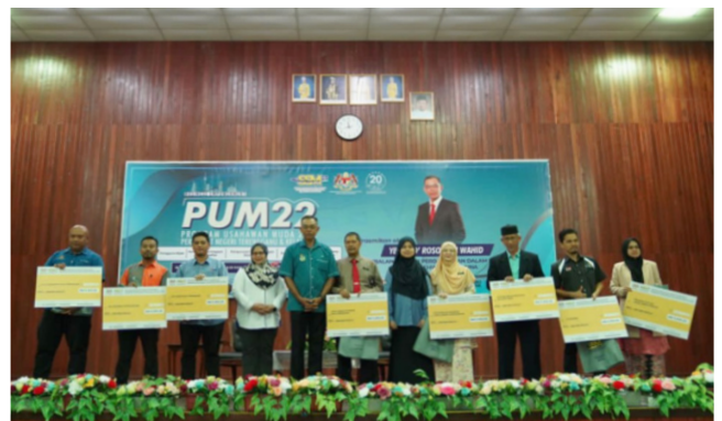
Program agihan WZK SSM kepada 13 penerima sempena penganjuran PUM22 bertempat di Dewan Akademi Binaan Malaysia, Kuala Berang, Terengganu pada 16 November 2022.