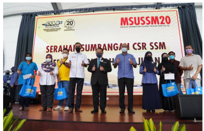
Majlis sumbangan zakat korporat dan serahan tanggungjawab sosial korporat bersempena dengan sambutan Hari Ulang Tahun SSM ke-20.