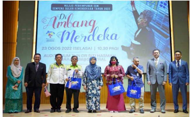
Majlis agihan WZK SSM dan CSR SSM kepada tiga (3) pertubuhan sempena Majlis Sambutan Bulan Kemerdekaan SSM 2022 di Auditorium Tun Dr. Siti Hasmah, Menara SSM@Sentral pada 28 Ogos 2022.

MOU ini merupakan satu bentuk kerjasama strategik yang bertujuan untuk menyokong keusahawanan, perkhidmatan rawatan kesihatan serta kebajikan kumpulan Asnaf dan kumpulan kategori B40 melalui pelbagai inisiatif dan sumbangan kewangan.