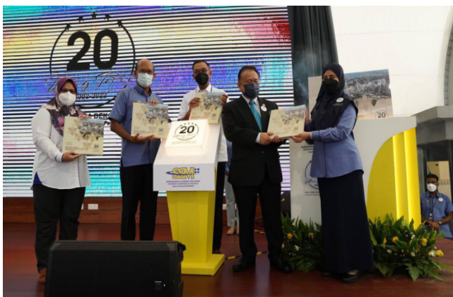
Pelancaran penerbitan khas buku 'SSM Dua Dekad: Inspirasi Kepercayaan Perniagaan'