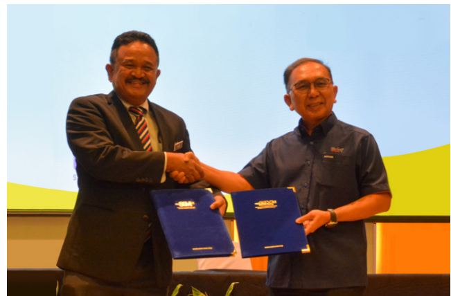
Majlis Menandatangani MoU antara SSM dan Waqaf An-Nur bertempat di Auditorium Tun Dr. Siti Hasmah, Menara SSM@Sentral pada 15 September 2022.