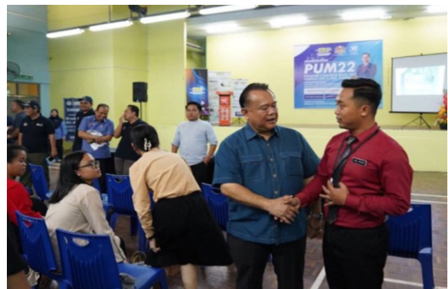
YB. Dato Sri Alexander Nanta Linggi, Menteri PDNHEP menyantuni peserta PUM22 Peringkat Daerah Kapit dan Song, Sarawak pada 8 November 2022.