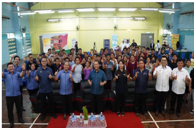
YB. Dato Sri Alexander Nanta Linggi, Menteri PDNHEP bersama peserta PUM22 Peringkat Daerah Kapit dan Song, Sarawak yang telah diadakan di Dewan Masyarakat Song pada 8 November 2022.