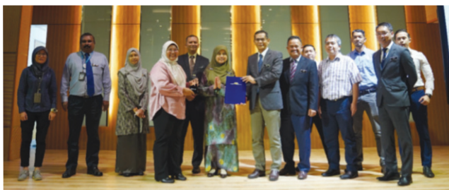
Tempat Ketiga - Kumpulan Destar Seruda (SSM Perak)