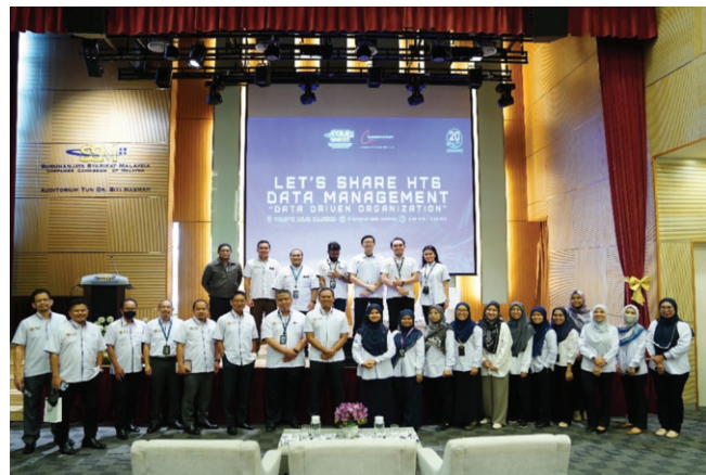
Kumpulan Pengurusan Perubahan bersama Pengurusan SSM di program Let's Share HT6: Data Management, "Data Driven Organization."